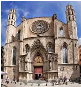
Santa María del Mar

http://www.santamariadelmarbarcelona.org/inicio/