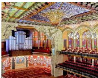
Palau de la Música Catalana