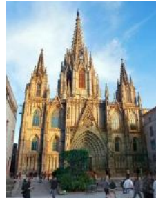
Catedral de Barcelona

https://catedralbcn.org/index.php?lang=es