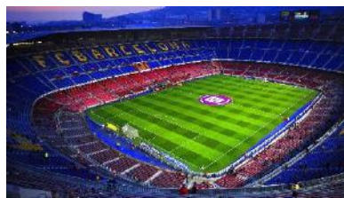
Museo F.C. Barcelona

https://www.fcbarcelona.es/tour/comprar-entradas