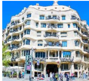
Casa Milà - La Pedrera

http://www.santamariadelmarbarcelona.org/inicio/