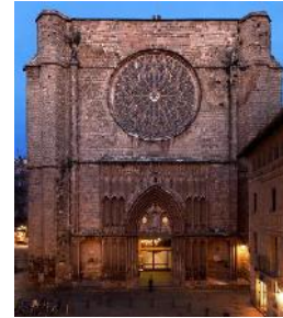
Basílica del Pi

https://catedralbcn.org/index.php?lang=es